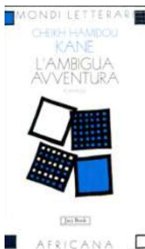
L'ambigua avventura , Jaka Book, 1979, 1998