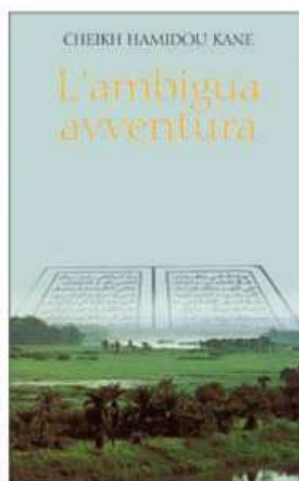
L'ambigua avventura , Edizioni e/o, 2003